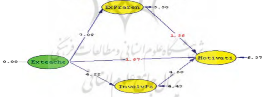
شکل ۲: مدل آزمون شده تحقیق (آزمون تی)