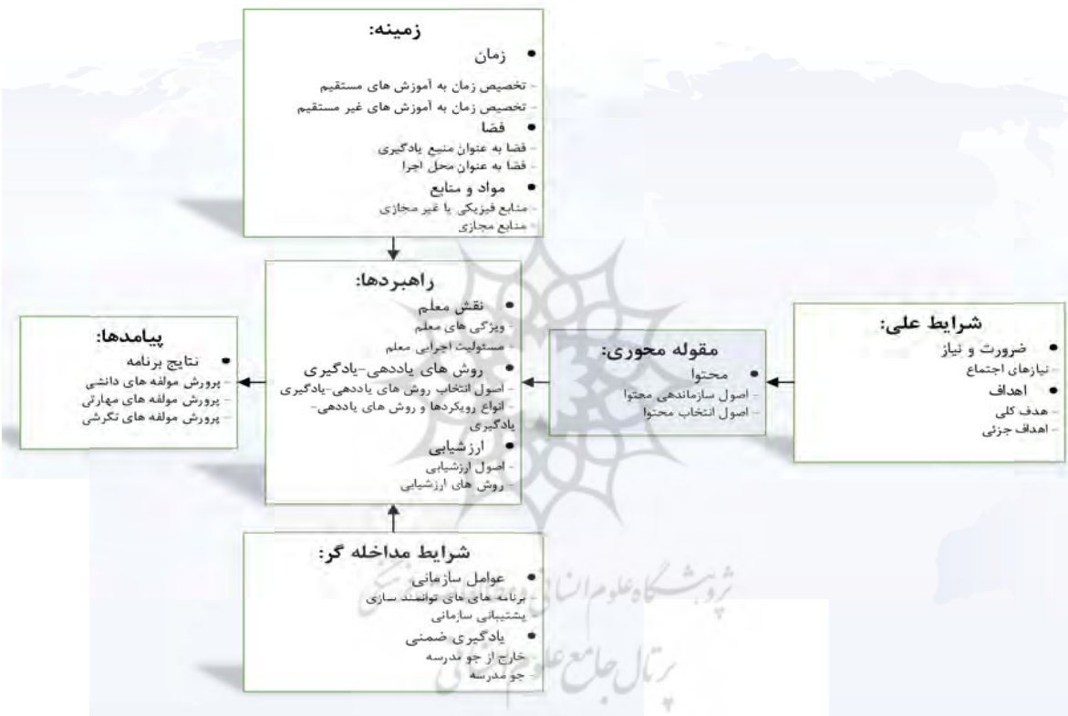
شکل ۱: مدل پارادایمی برنامه‌درسی تربیت شهروند جهانی در دوره ابتدایی (بر اساس طرح نظامند داده‌بنیاد)