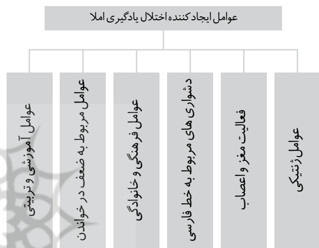
نمودار ۱- عوامل ایجادکننده اختلال یادگیری املا

به‌منظور تسهیل فهم موضوع عوامل موثر در اختلال و مشکل‌های املا به تفکیک بررسی می‌شوند. هم‌چنین، باید به این نکته توجه داشت که هیچ‌گاه يك عامل به تنهایی نمی‌تواند سبب اصلی اختلال در یادگیری املا شود بلکه تمام عوامل در تعامل نزدیک با هم هستند. در ادامه مهم‌ترین عوامل ایجاد اختلال یادگیری املا، همان‌گونه که در نمودار شماره ۱ قابل مشاهده هستند، مرور می‌شوند: