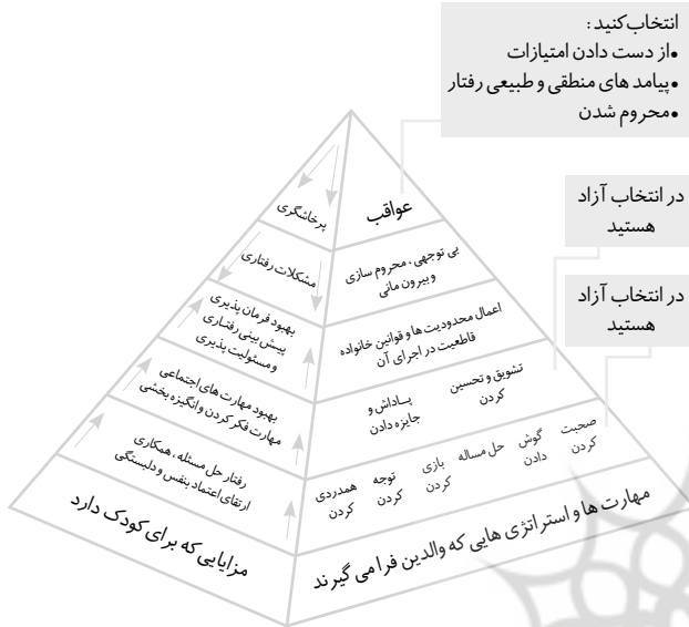
شکل ۴. الگوی سال‌های باورنکردنی (وبستر استراتون، ۲۰۱۶)

می‌آورد (۲۶). این برنامه بر مداخله مبتنی بر والدگری و روش‌های برقراری ارتباط، استوار است و در آن از روش‌هایی چون آموزش ویدیویی، ایفای نقش و روش‌های مبتنی بر عملکرد استفاده می‌شود (۲۷). بر همین اساس وبستر استراتون، الگویی را برای برنامه سال‌های شگفت‌انگیز ارائه کرد که در شکل ۴ نشان داده شده است.