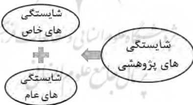
شکل ۲: دسته‌بندی شایستگی‌های پژوهشی به دو دسته عام و خاص

گام سوم؛ مصاحبه با متخصصین: در این مرحله، دو مصاحبه نیمه سازمان یافته در مجموع با شش متخصص علوم تربیتی و روان‌شناسی دانشگاه فردوسی مشهد انجام شد. در مصاحبه اول، فهرست اولیه شایستگی‌ها با هدف «ارزیابی، تکمیل و جامع کردن آن» در اختیار سه متخصص قرار گرفت و از آن‌ها خواسته شد تا نظر اصلاحی و یا تکمیلی خویش را در مورد این فهرست اعلام کنند. متخصصین فوق، برخی شایستگی‌ها را با یکدیگر هم معنی دانسته و یا ادغام نمودند (کاوش و جستجوی اطلاعات، توسعه و بسط آموخته‌ها و کاربرد آموخته‌ها در موقعیت جدید، خلاصه کردن و گزارش‌نویسی، تشخیص و کنترل متغیرها و ارائه تعاریف آن‌ها، مشاهده از ابزار جمع‌آوری اطلاعات). متخصصین با توجه به شایستگی‌های مطرح شده پیشنهاد کردند که شایستگی‌ها به دو دسته شایستگی‌های پژوهشی عام و خاص تقسیم شوند.