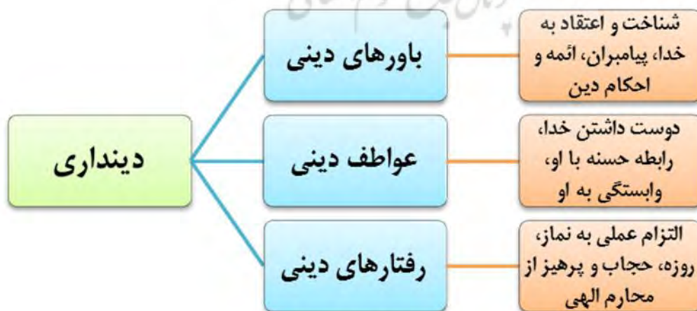
شکل ۲- مفهوم‌پردازی دینداری بر اساس ادبیات پژوهش و یافته‌های پژوهش حاضر