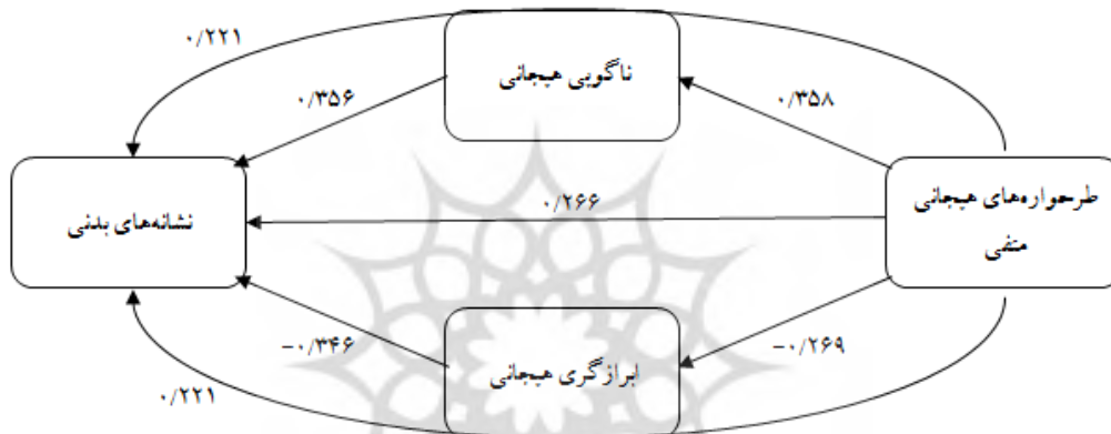
نمودار ۲. مسیرهای مدل برازش یافته مربوط به رابطه بین طرح‌واره‌های هیجانی منفی و نشانه‌های بدنی با میانجیگری ناگویی هیجانی و ابراز گری هیجانی (ضرایب استاندارد، p < 0.001 ) (***)

و نشانه‌های بدنی رابطه وجود دارد. اما این رابطه مستقیم با در نظر گرفتن نقش واسطه‌ای ابراز گری هیجانی و ناگویی هیجانی کاهش یافتند، با این وجود اثر مستقیم کامل حذف نشده است. این یافته‌ها به روشنی تأیید می‌کند که اثر طرح‌واره‌های هیجانی منفی بر نشانه‌های بدنی هم به صورت مستقیم و هم به صورت غیرمستقیم از طریق ناگویی هیجانی و سرکوب هیجان صورت می‌گیرد. جهت درک بهتر روابط درون مدل نمودار برازش یافته در شکل ۲ آورده شده است.