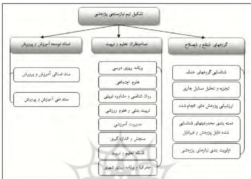
شکل ۲. عناصر موردنظر در فرایند نیازسنجی پژوهشی بر اساس الگوی پیشنهادی

۱-۲. نیازهای پژوهشی اداره کل آموزش و پرورش خراسان رضوی از دیدگاه گروه‌های مورد مطالعه کدام‌اند؟ با نظر به نتایج به دست آمده، مهم‌ترین نیازهای پژوهشی آموزش و پرورش استان از سه منظر گروه‌های ذینفع، صاحب نظران تعلیم و تربیتی و اسناد توسعه شناسایی و احصاء شدند که به شرح زیر عبارت‌اند از: