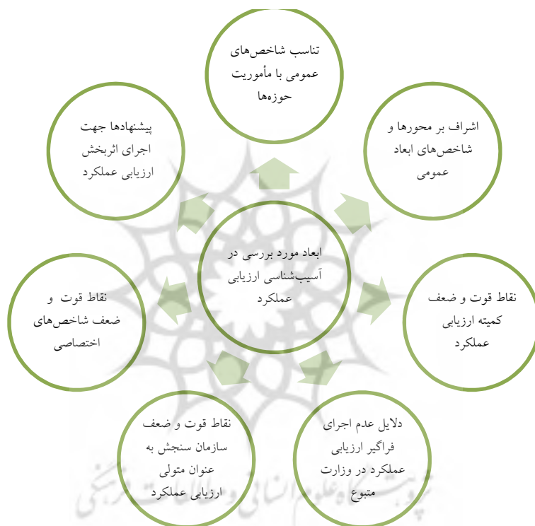
نمودار (۴) ابعاد مورد بررسی در فرا-ارزشیابی ارزیابی عملکرد

قضاوت مربوط به ارزشیابی‌های تکمیل شده طراحی می‌شود، تمایز قائل شدند (هانسن و همکاران ۱ ، ۲۰۰۸: ۵۷۲). از این رو، فرارزشیابی مورد نظر در پژوهش حاضر، از نوع معطوف به گذشته است. فرارزشیابی (آسیب‌شناسی) ارزیابی عملکرد وزارت متبوع به طور سالانه صورت می‌گیرد. هفت مؤلفه یا عامل کلیدی مورد بررسی در این فرا-ارزشیابی، در نمودار زیر ترسیم شده است: