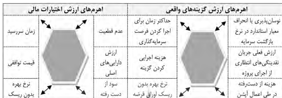
شکل ۱. اختیارات واقعی در برابر اختیارات مالی

همچنین مایرز در مقاله خود شباهت‌های بین اختیارهای مالی و واقعی را مورد ملاحظه قرار داد. شکل ۱ به مقایسه اختیارات واقعی با اختیارات مالی می‌پردازد [۴].