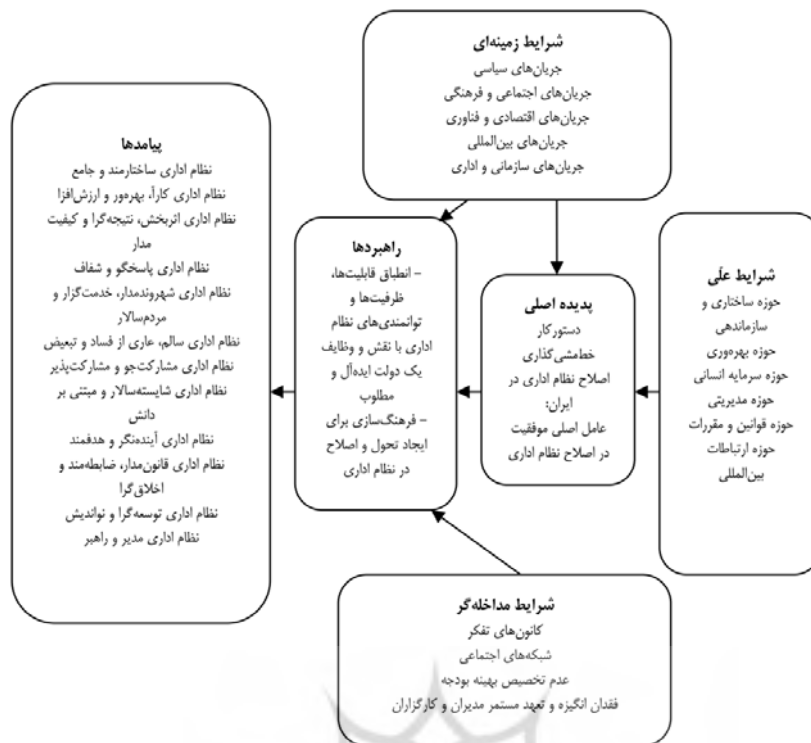
شکل ۱. الگوی دستور کار خط‌مشی‌گذاری اصلاح نظام اداری در ایران

آزمون اجرایی و تعیین روایی مدل. برای تعیین روایی مدل، آزمون اجرایی و بازبینی آن، از گروه کانونی متشکل از متخصصان نظام اداری و با مدل‌سازی معادلات ساختاری انجام شده است که شامل تحلیل عاملی تأییدی ۱ (CFA) و مدل ساختاری است. کفایت نمونه‌گیری و مناسب بودن حجم گروه نمونه به‌وسیله آزمون‌های آماری KMO و بارتلت تأیید شد؛ همچنین نتایج آزمون کلموگروف - اسمیرنوف ۲ (KS) نشان داد که توزیع داده‌ها، نرمال است.