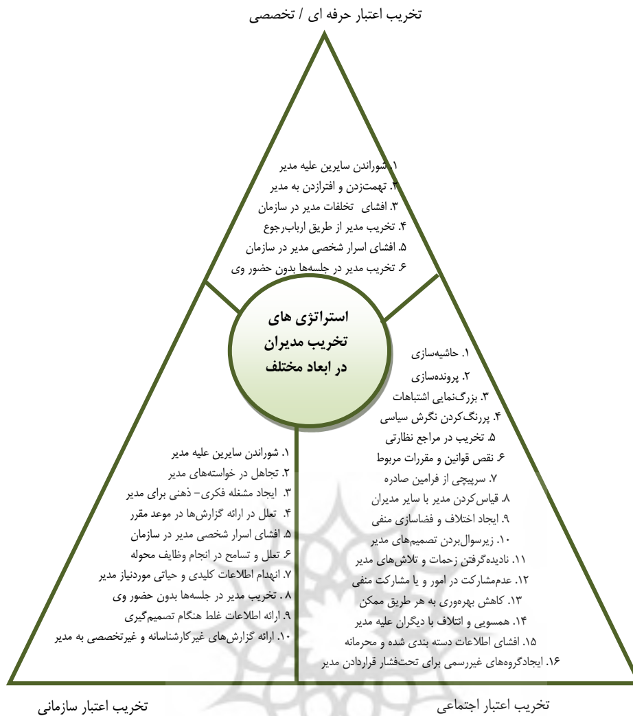
شکل ۴. طبقه‌بندی استراتژی‌ها بر حسب هدف تخریب مدیر