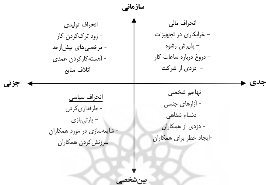
شکل ۳. نوع‌شناسی رفتارهای انحرافی کاری (رابینسون و بنت، ۱۹۹۵)

- انحراف مالی ۱ : شامل کسب یا اتلاف اموال سازمان بدون تأیید آن است؛ نظیر دزدی و دست‌کاری در حساب‌های هزینه. - تهاجم شخصی ۲ : شامل خصومت و رفتارهای تجاوزکارانه نسبت به دیگران می‌شود که می‌تواند اعتبار سازمان را به خطر بیندازد و پیامدهای جدی منفی برای افراد موردنظر داشته باشد. در شکل ۳، این طبقه‌بندی‌ها نشان داده شده و نمونه‌هایی از هر طبقه ارائه شده است.