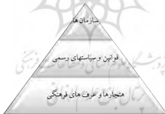
شکل ۳: تبیین سه سطحی از مفهوم نهاد

سازمان‌ها، ساختارهای رسمی با مقصودی مشخص هستند که آگاهانه ایجاد شده‌اند. سازمان‌ها، بازیکنان ۱ یا بازیگران ۲ سیستم‌های نوآوری به‌شمار می‌آیند. عرف شامل عادات مشترک، رویه‌ها، رسومات جاافتاده، قواعد یا قوانینی است که روابط و تعاملات افراد، گروه‌ها و سازمان‌ها را تنظیم می‌کنند و قواعد بازی هستند (Edquist and Johnson, 2997). بر اساس این مفهوم‌پردازی، پژوهشگران در این مطالعه به دنبال پاسخگویی به این سؤال هستند که مهم‌ترین نهادهای مؤثر بر نوآوری فناوری اطلاعات کدام‌اند؟