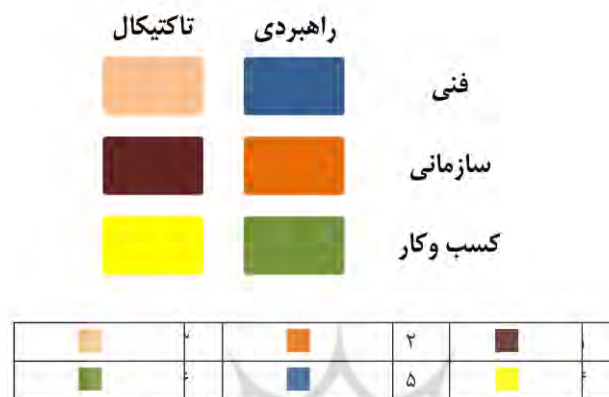
شکل ۳. اولویت‌بندی نواحی شکاف

مخاطرات ممکنه در بخش سازمانی و در وهله بعد مربوط به بخش اجرایی فرآیند پیاده‌سازی (بخش تاکتیکیال و کوتاه‌مدت چرخه حیات) می‌باشد. از این نظر بخش راهبردی یا در واقع زیرساختارهای بلندمدت پروژه از مشکلات کمتری برخوردار هستند (شکل چهار). در ناحیه مخاطره‌آمیز سوم (تاکتیکیال-فنی) عوامل توسعه، تست و اشکال‌زدایی سیستم، انتخاب سیستم مناسب و سفارشی‌سازی سیستم، انتخاب عرضه‌کننده مناسب و عوامل مرتبط با مدیریت پروژه دارای شکاف هستند.