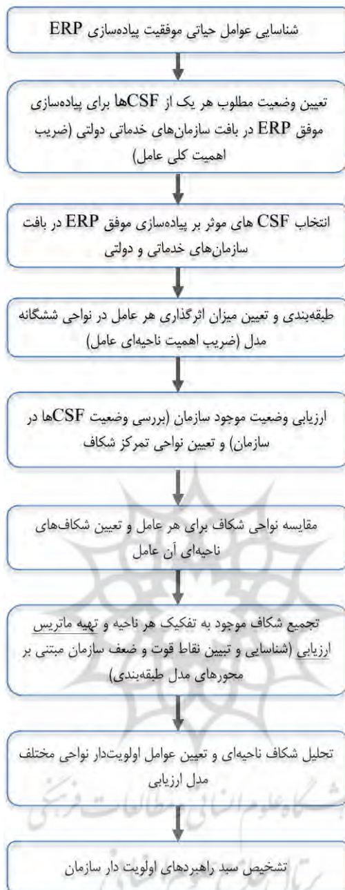
شکل ۱. چارچوب ارزیابی آمادگی سازمان برای پیاده‌سازی ERP