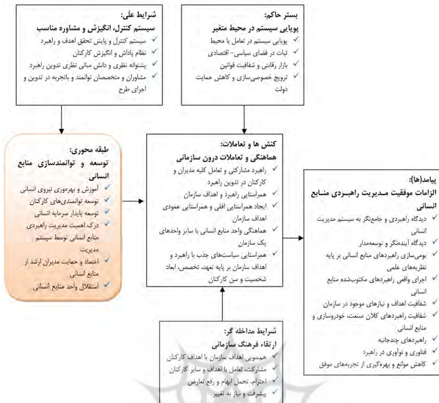
شکل ۱. کدگذار محوری براساس مدل پارادایم

دلایل انتخاب هر یک از طبقات اصلی عبارت‌اند از: