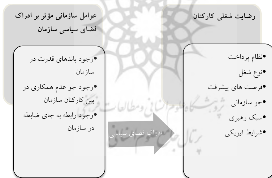
شکل ۲. مدل مفهومی تحقیق

مدل مفهومی پژوهش. مدل مفهومی که تحقیق حاضر بر اساس آن انجام شده بر گرفته از مدل ارائه شده توسط فریس و کاکمار در سال ۱۹۹۹ می‌باشد. در قسمت های قبلی توضیحات کاملی در مورد تحقیقاتی که به ارائه این مدل منجر شده ذکر شده است.