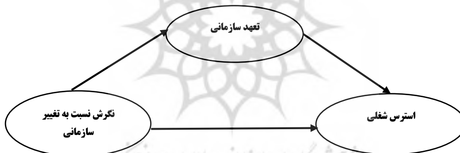
شکل ۱: مدل مفهومی تحقیق

برای نیل به هدف اصلی پژوهش و به منظور پیش بینی احتمالی وجود رابطه بین متغیرهای پژوهش با توجه به پیشینه پژوهش الگویی طراحی شده است که رابطه مستقیم و غیر مستقیم نگرش نسبت به تغییر سازمانی و تعهد سازمانی با استرس شغلی را نشان می‌دهد، با ارزیابی روابط میان متغیرها و معنادار بودن روابط هر کدام، ضریب برازش الگو مورد بررسی قرار می‌گیرد. ساختار مفهومی پژوهش حاضر در شکل (۱) نمایش داده شده است. همانطور که از مدل بر می‌آید رابطه نگرش نسبت به تغییر سازمانی با استرس شغلی به طور مستقیم و غیر مستقیم به واسطه نقش میانجی تعهد سازمانی مورد بررسی قرار گرفته است.