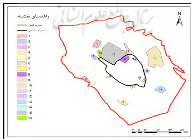
شکل ۲- موقعیت گزینه‌های ۱۶ گانه مسکن مهر شهر کازرون

عواملی همچون موقعیت طبیعی، دسترسی، امکانات اقتصادی، استقلال حقوقی، زیرساخت‌ها (تأمین آب، برق، گاز، تلفن، توجه به شبکه معابر اصلی و فرعی) عواملی هستند که باید در مکان‌گزینی مسکن مهر لحاظ گردد. بر این اساس با توجه به نقطه نظرات کارشناسان و مدیران شهری، ۱۶ گزینه برای ایجاد مسکن مهر در شهر کازرون انتخاب شد (شکل ۲ و جدول ۱).