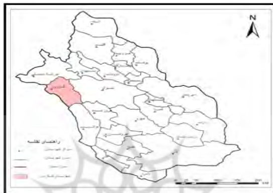
شکل ۱- موقعیت کازرون در استان فارس (مأخذ: سالنامه آماری استان فارس، ۱۳۸۴)

سطح دریا حدود ۸۵۰ متر می‌باشد که بلندترین نقطه آن با ارتفاعی بیش از ۲۲۲۰ متر در شرق و پست‌ترین ارتفاع آن کمتر از ۷۸۰ متر در شمال‌غرب دشت حوضه آبریز رودخانه شاپور واقع شده است (طرح تفصیلی شهر کازرون، ۱۳۸۱: ۱۳).