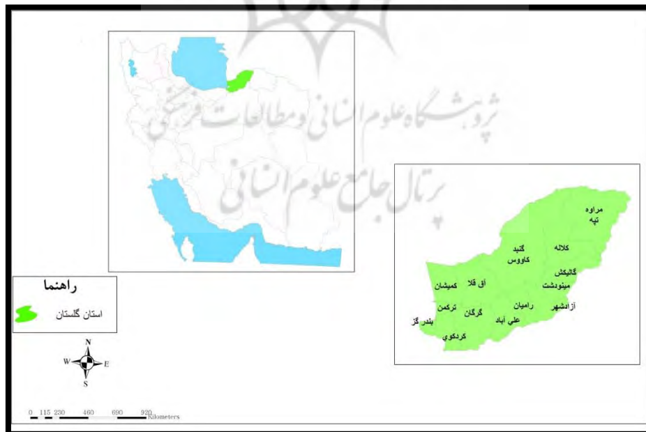
شکل ۱. موقعیت فضایی استان گلستان؛ منبع: یافته‌های پژوهش، ۱۳۹۵

استان گلستان از سال ۱۳۷۶ از استان مازندران جدا شد و به صورت مستقل درآمد؛ شهرستان گرگان نیز به عنوان مرکز آن برگزیده شد. این استان در محدوده جغرافیایی ۵۴ درجه تا ۵۶ درجه طول شرقی و ۳۶/۳۰ تا ۳۸/۱۵ عرض شمالی و در بین استان‌های مازندران، سمنان و خراسان شمالی قرار دارد. گلستان با ترکمنستان هم‌جوار است و ۳۴۸ کیلومتر مرز خاکی و ۹۰ کیلومتر مرز آبی با این کشور دارد. این استان به دلیل جایگاه جغرافیایی ویژه خود، آب‌وهوای گوناگونی نیز دارد. بخشی از رشته‌کوه البرز شرقی از غرب به سوی شرق استان کشیده شده که گرایش زیادی به سوی شمال شرقی دارد و به تدریج از بلندی کوه‌های آن کاسته می‌شود. جمعیت استان گلستان براساس سرشماری سال ۱۳۹۰ بالغ بر ۱ میلیون و ۷۷ هزار و ۱۴ نفر است که از این تعداد ۵۱ درصد شهرنشین و ۴۹ درصد روستانشین هستند. این استان از اسفند سال ۱۳۹۰ دارای ۱۴ شهرستان به نام‌های آزادشهر، آق‌قلا، گرگان، گنبد کاووس، بندر ترکمن، گمیشان، رامیان، کردکوی، بندرگز، علی‌آباد کتول، گالیکش، کلاله، مراوه تپه و مینودشت و دارای ۲۶ شهر و ۲۷ بخش و ۶۰ دهستان است.