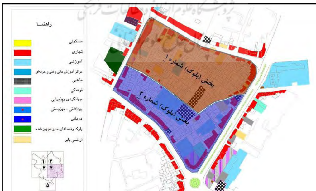
نقشه ۲. تفکیک محله به دو بخش (نگارندگان، ۱۳۹۵)