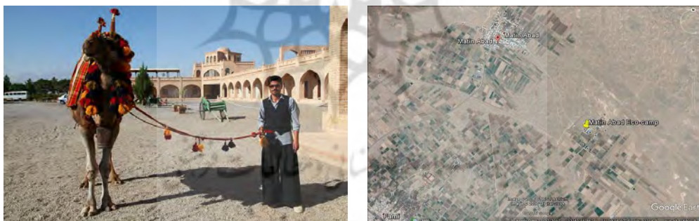
شکل ۱- موقعیت جغرافیایی روستا و کمپ متین‌آباد شکل ۲- ساربان‌ی و پرورش شتر در اکوکمپ متین‌آباد