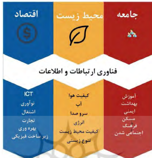
شکل ۴- چهارچوب شهرهای هوشمند پایدار تهیه شده توسط UNECE-ITU (Adeoluwa Akande/2019)

استفاده می کند، در حالیکه اطمینان حاصل می کند که نیازهای نسل های کنونی و آینده با احترام به جنبه های اقتصادی، اجتماعی، محیط زیست و همچنین فرهنگی برآورده شود (Adeoluwa Akande/2019). توانایی یک شهر برای حفظ تعادل اکوسیستم، در حالی که خدمت و امور شهر در حال انجام است به عنوان پایداری شناخته میشود. زیرساخت های سازمانی، فیزیکی، اجتماعی و اقتصادی به عنوان چهار ستون شهر هوشمند در نظر گرفته می شوند. (Bhagya Nathali Silva/2018) شکل شماره ۴ به بیان مولفه های توسعه پایدار پرداخته و تاثیراتی که فناوری اطلاعات و ارتباطات میتواند بر روی هر کدام از این مولفه ها ایجاد کند را بیان میکند (Adeoluwa Akande/2019).