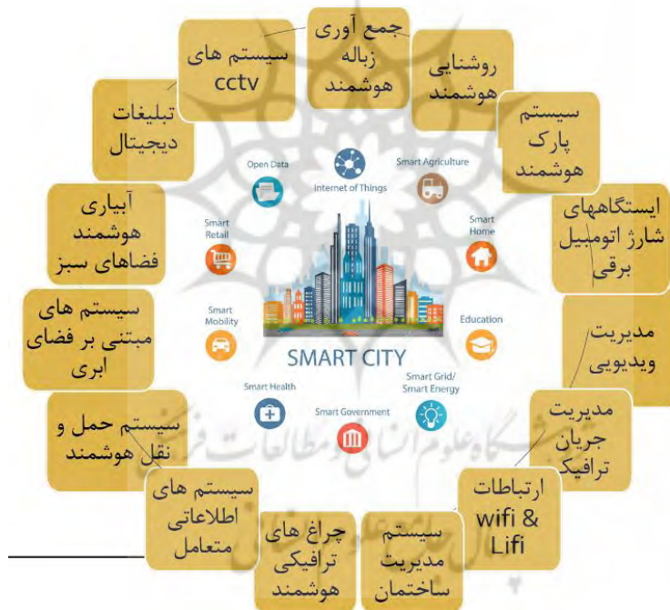
شکل ۳- چهار چوب شهر هوشمند Lusail قطر

شکل ۳ چهارچوب پیاده سازی شهر هوشمند Lusail در قطر را بیان میکند.