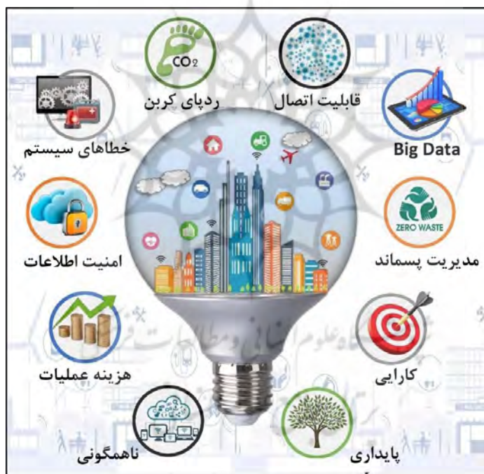
شکل ۵- چالش های دستیابی به شهر هوشمند (Bhagya Nathali Silva/2018).