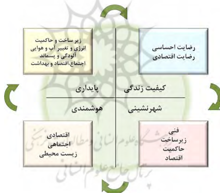
شکل ۱- ویژگی های شهر هوشمند (Bhagya Nathali Silva/2018)

شکل شماره ۱ ویژگی های شهر هوشمند را در چهار دسته اصلی کیفیت زندگی، پایداری، شهرنشینی و هوشمندی بیان میکند، سپس محدوده عمل و تاثیر هر یک از این چهار عامل را به صورت خلاصه بیان میکند. همچنین شکل زیر گویای این نکته نیز هست که هوشمند سازی و توسعه پایدار در رابطه متقابل دائمی بوده و باید به آنها مانند یک چرخه نگاه کرد (Bhagya Nathali Silva/2018).