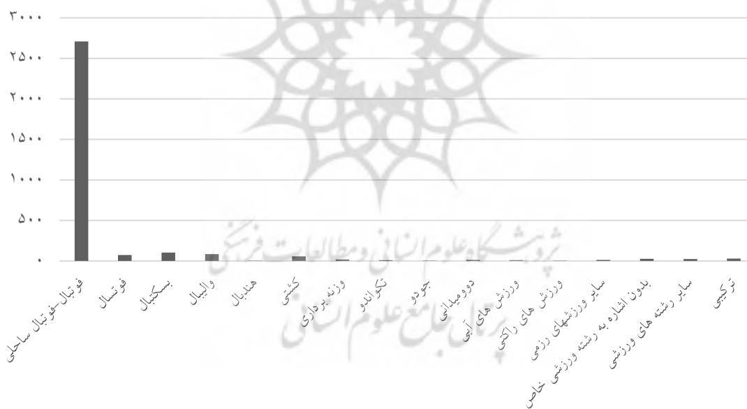
نمودار ۱- میزان پوشش رشته‌های ورزشی در ابرار ورزشی