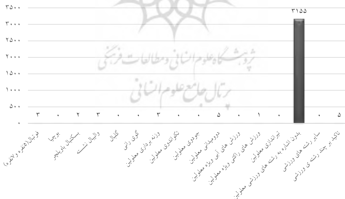
نمودار ۳- میزان پوشش رشته‌های ورزشی معلولين در ايرار ورزشی