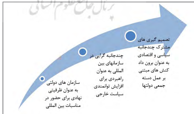
شکل (۱): منحنی منطق کنش سازمان دولتی

همانند ناتو در تسهیل روابط بین کشورها و هم در رفتار کشورها تأثیر می‌گذارند. این نهادها با ایجاد هنجارها و معاهده‌ها خصوصیت آنارشیک سیستم بین‌الملل را تعدیل می‌سازند و با مدیریت و حل اختلافات محلی و منطقه‌ای در تشکیل اتحاد و تحول همکاری امنیتی، چارچوب قابل اطمینانی برای تعامل کشورها فراهم می‌کنند. جایگاه دیپلماسی چندجانبه در این نظریه به دلیل تأکید بر فرایندهای همکاری جویانه بین‌دولتی از اهمیت بالایی برخوردار است. ابزارهای چندجانبه‌گرایی در این نظریه عمدتاً در دو بُعد سیاسی و اقتصادی تقسیم‌بندی می‌شوند. مذاکرات دولت‌ها در قالب فرایندهای نهادی، ابزار عملی و میدانی است که بازیگران دولتی در قالب کنش‌های چندجانبه‌گرا از آن استفاده می‌کنند. چندجانبه‌گرایی در محدودترین تعریف به تعامل بیش از دو کشور در سطح تساوی نسبی در تصمیم‌گیری‌های کلان گفته می‌شود و هر چه تعداد اعضای تصمیم‌گیر و هماهنگی و همگرایی بازیگران در تصمیم‌سازی بیشتر باشد کارکرد دیپلماسی چندجانبه در آن نهاد در سطوح بالاتری ارزیابی می‌گردد. در واقع، حرکت هماهنگ کشورها به منظور دستیابی به یک هدف و یا وضعیت دلخواه معین شده جوهره چندجانبه‌گرایی را دربرمی‌گیرد. (بزرگی، ۱۳۸۹: ۳۹) در این فضای اشتراک نسبی رفتاری استفاده از ابزار چندجانبه‌گرایی به عنوان ظرفیتی پویا و سیال به منظور مدیریت بحران‌ها و افزایش سطح قدرت منطقه‌ای و جهانی در دستور کار قدرت‌های بزرگ جهانی قرار می‌گیرد. در شکل زیر نمایی ساده‌سازی شده از منحنی منطق کنش سازمان‌های دولتی به تصویر درآمده است.