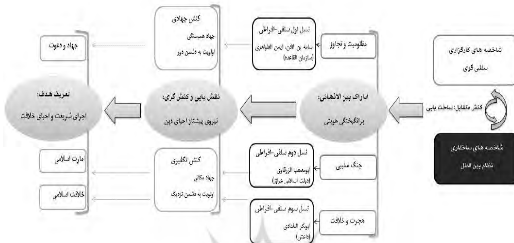
شکل شماره ۲: الگوی مفهومی هویت‌یابی اسلام تکفیری متأثر از ساختار نظام بین‌الملل

ویژگی حضور پررنگ مسلمانان اروپایی از نسل‌های پیشین متمایز می‌گردد.