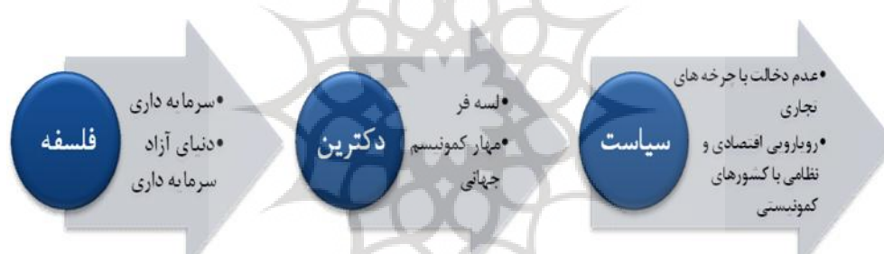
نمودار ۲: رابطه فلسفه، دکترین و سیاست

شناخت دکترین، از آنجایی شروع می‌شود که هر فلسفه و نظام شناختی، الزاما برای پیاده‌شدن در متن اجتماع و بیان چگونگی حیات انسانی، نیاز به واسطه‌ای دارد. ۱ بر این اساس، دکترین موضوعیت پیدا می‌کند که غبار ابهام را از چهره آن می‌زداید تا بتواند به سیاست‌های مشخصی جهت اداره انسان تبدیل شود. از این حیث، دکترین حاکم، ضرورتاً یک ایدئولوژی و مجموعه‌ای سازمان‌یافته درباره بهترین شیوه زندگی مردم و درباره مناسب‌ترین ترتیبات نهادی برای جوامع‌شان می‌باشد. بنابراین، دکترین (یا قاعده القواعد) تبیین و تشریح قواعد ذاتی حاکم بر خلقت، طبیعت و قواعد ذاتی حاکم بر اعمال موجودات، به ویژه بشر است. تبیین این قواعد برای جامعه‌سازی الزامی است. لذا موضوع این رویکرد، مطالعه جامعه از حیث «باید»، مبتنی بر قواعد ذاتی حاکم بر خلقت، طبیعت و رفتار موجودات و انسان است. نمودارهای زیر، روابط مزبور را به همراه مصداقی روشن، به خوبی ترسیم کرده است (شافریتز و پی. بریک، ترجمه ملک محمدی، ۱۳۹۰: ۲۸۳-۲۹۹)