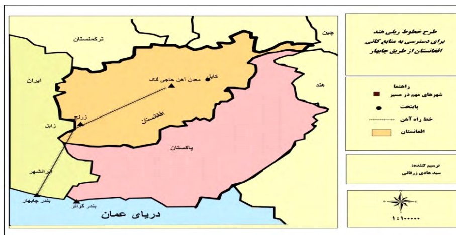
نقشه ۲. پروژه خطوط ریلی برای دسترسی هند به منابع کانی افغانستان از مسیر ایران