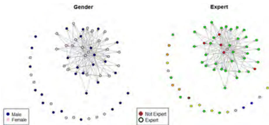
شکل ۳: همگرایی اعضای شبکه همکاری علمی مشاهده شده بر حسب جنسیت و تخصص