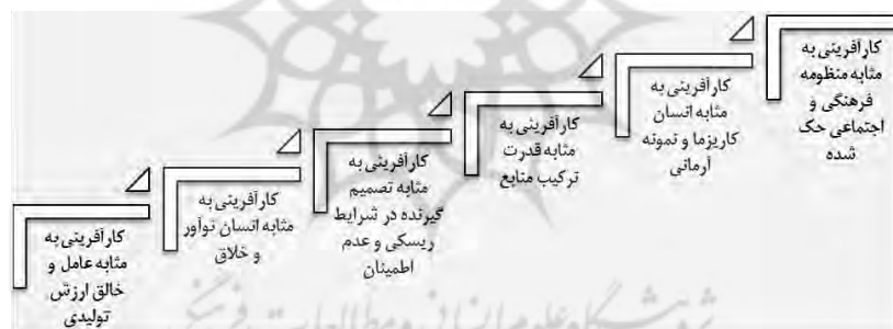
مدل شماره (۱) وجوه نظری کارآفرینی

با رویکرد جدید، ظهور کارآفرینی قومی- شبکه‌ای چه در میان اقلیت‌های مهاجر و چه غیرمهاجران با قابلیت‌های فرهنگی، اجتماعی و تاریخی آنها گره خورده و به نهادسازی و بازتولید ارزش‌های خاستگاهی در مبدأ محل سکونت و در شهرهای مقصد مدد می‌رسانند. این گروه دارای تأثیرات و پیامدهای مثبت در حاشیه فضاهای شهری و فعالیت‌های غیررسمی داشته و توانسته در ظهور نوعی کارآفرینی قومی- شبکه‌ای دامن بزنند. کارآفرینان مهاجر بیش از آنکه به واسطه جبر ساختاری نظیر اصلاحات ارضی به حاشیه محیط شهری رانده شوند، اساس روحیه کارآفرینی و منطق عرضه و تقاضای اقتصادی به دنبال دستیابی به فرصت‌های اقتصادی بکر و مناسب بوده‌اند (والدینگر و همکاران، ۱۳۹۴: ۱۵۲).