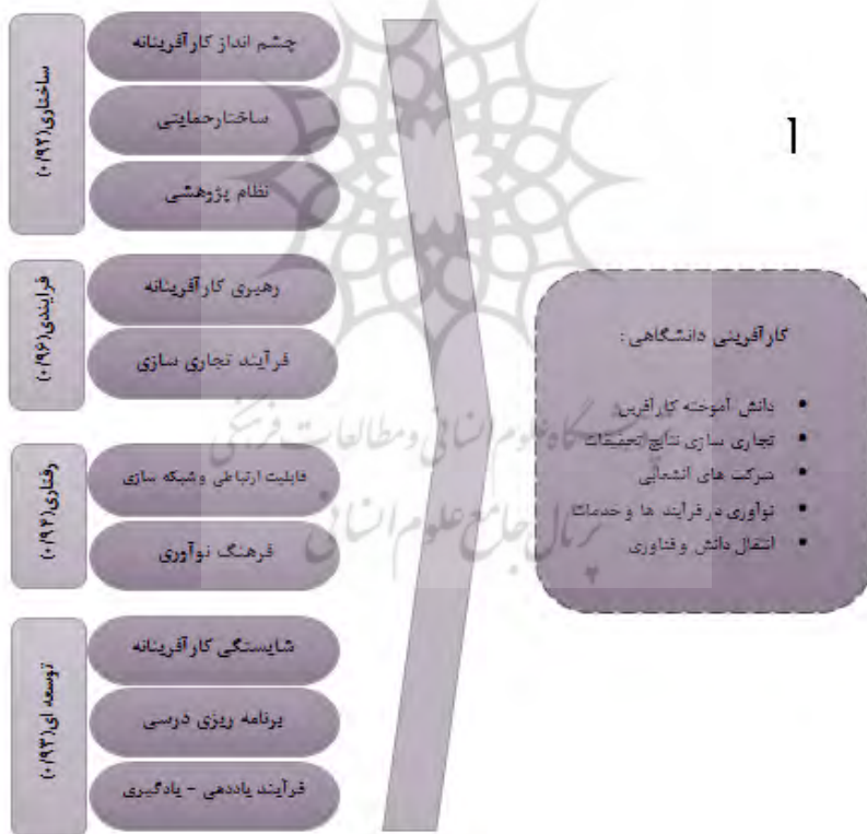
شکل ۳- الگوی مفهومی کارآفرینی دانشگاهی دانشگاه فنی و حرفه ای

نهایت اینکه الگوی کارآفرینی دانشگاهی برای دانشگاه فنی و حرفه‌ای با ۴ بعد، ۱۰ مولفه و ۷۰ شاخص مورد تأیید و به شکل زیر ترسیم شد.