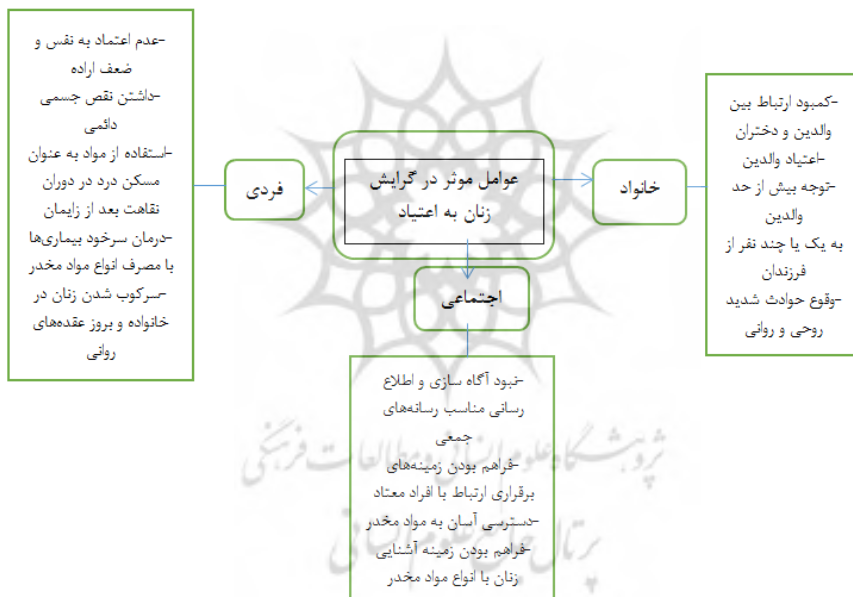
شکل شماره (۲) مدل تحقیق: عوامل اصلی و مؤلفه‌های مؤثر بر گرایش زنان به اعتیاد به مواد مخدر

براساس هدف پژوهش حاضر، مدل تحقیق در شکل شماره (۲) عوامل اصلی و زیر مولفه‌هایی که موجب گرایش زنان به سمت اعتیاد را موجب می‌شوند نشان می‌دهد. که در این پژوهش قصد داریم به بررسی و ارایه مدل تحلیل عاملی با استفاده از نرم افزار Amos پردازیم.