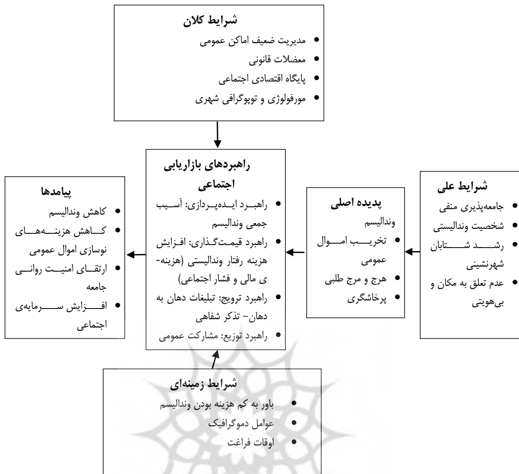
نمودار ۲- مدل کاربرد بازاریابی اجتماعی در پیشگیری از رفتارهای وندالیسم