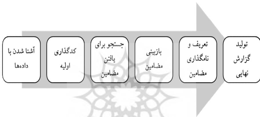
شکل 2- گام‌های روش کیفی

این پژوهش از نوع کیفی بوده و بر آن است تا با استفاده از روش «تحلیل مضمون» 1 به گردآوری، تحلیل و تفسیر موضوع پژوهش اقدام نماید. روش تحلیل مضمون را این‌گونه تعریف نموده‌اند: «تحلیل مضمون، روشی برای شناخت، تحلیل و گزارش الگوها(یا مضامین) موجود در داده‌های کیفی است. این روش، فرایندی برای تحلیل داده‌های متنی است و داده‌های پراکنده و متنوع را به داده‌هایی غنی و تفصیلی تبدیل می‌کند»(عابدی جعفری و دیگران، 1390: 153). این روش شش گام دارد که عبارتند از: