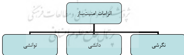
شکل 1- مدل مفهومی پژوهش

وقتی صحبت از امنیت انتظامی به میان می‌آید، در حقیقت با مجموعه‌ای چند بُعدی از الزامات امنیت‌ساز مواجه می‌شویم که از مشروعیت نظام سیاسی تا تحول در امکانات لجستیکی و از ارتقاء سطح کمی و کیفی نیروی انسانی تا ورود به عرصه‌های جدید اطلاعاتی و ارتباطی را شامل می‌شود که به طور کلی، می‌توان این الزامات را در مدل پژوهشی زیر ارائه نمود: