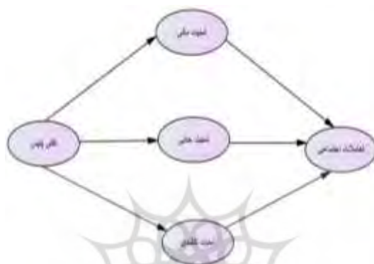
شکل ۱: مدل مفهومی پژوهش

مدل مفهومی تحقیق حاضر ارائه شده است. پس از بیان تحقیقات مرتبط با مؤلفه‌های امنیت اجتماعی و نقش پلیس و تعاملات مدل مفهومی این پژوهش که برگرفته از ادبیات موضوع، پیشینه پژوهشی و تحقیقات بیان شده در قسمت قبل می‌باشد به صورت زیر ارائه می‌گردد.