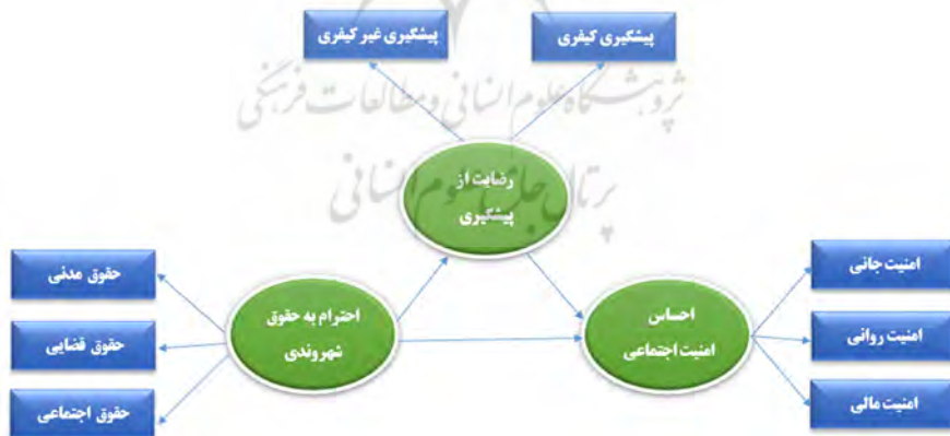
شکل شماره ۱: مدل مفهومی پژوهش

با توجه به نظریه‌های ذکر شده و همچنین پیشینه پژوهش می‌توان مدل مفهومی این مطالعه را به‌صورت زیر ترسیم کرد: