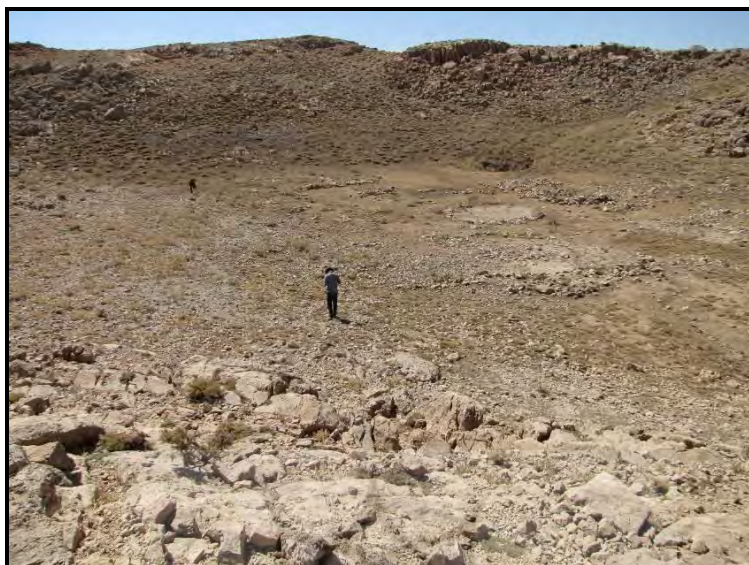
تصویر ۴. نمای عمومی محوطه گوراب چرکو، دید از شمال (خسروزاده، ۱۳۸۹)

تداوم زندگی کوچ‌نشینی از دوره پیش از... _____علیرضا خسروزاده و همکار