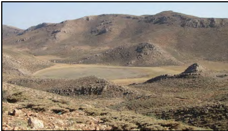
تصویر ۵ نمای عمومی گوراب کوچک، دید از شمال (خسروزاده، ۱۳۸۹).

تیغه‌ها و تراشه‌های سنگی با اثر ساییدگی در لبه از شواهد باستان‌شناختی است که اطراف گوراب‌های کوچک (تصویر ۵) و بزرگ (تصویر ۶) و بردتشدان درست جایی که سنگچین وارگه‌های عشایری برپا شده یافت شده‌اند. این منطقه به دلیل ارتفاع زیاد و داشتن برف در طول سال و وجود چاله‌های برف تنها در بهار و تابستان قابل استفاده بوده و راه دسترسی به آن از میان پیچ و خم‌ها و بریدگی‌های طبیعی و تقریباً یک روز پیاده‌روی امکان‌پذیر است.