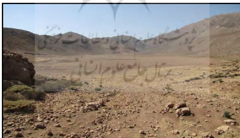
تصویر ۶ نمای عمومی گوراب بزرگ، دید از شمال (خسروزاده، ۱۳۸۹).

تیغه‌ها و تراشه‌های سنگی با اثر ساییدگی در لبه از شواهد باستان‌شناختی است که اطراف گوراب‌های کوچک (تصویر ۵) و بزرگ (تصویر ۶) و بردتشدان درست جایی که سنگچین وارگه‌های عشایری برپا شده یافت شده‌اند. این منطقه به دلیل ارتفاع زیاد و داشتن برف در طول سال و وجود چاله‌های برف تنها در بهار و تابستان قابل استفاده بوده و راه دسترسی به آن از میان پیچ و خم‌ها و بریدگی‌های طبیعی و تقریباً یک روز پیاده‌روی امکان‌پذیر است.