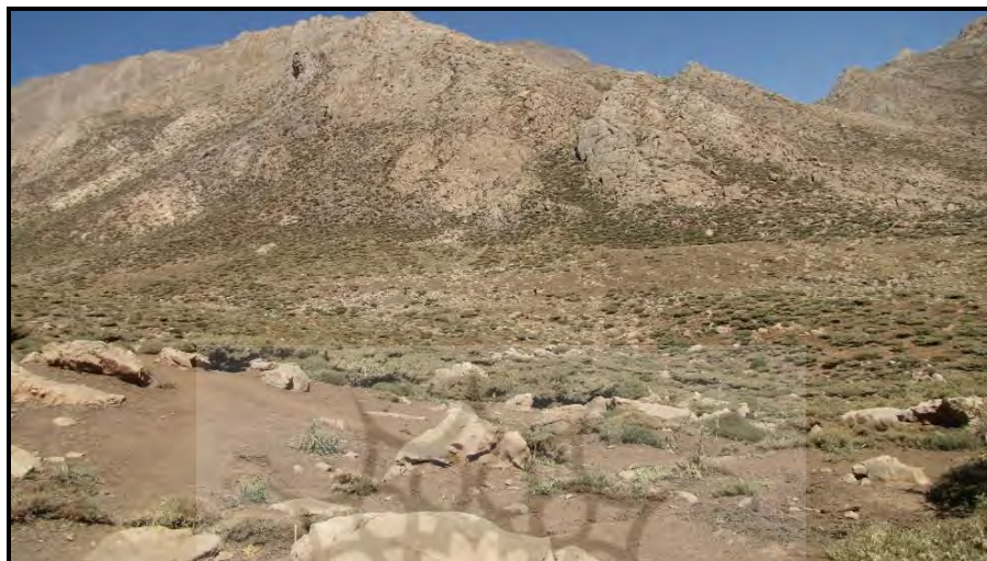
تصویر ۲. نمای عمومی محوطه گله جنگی، دید از جنوب (خسروزاده، ۱۳۸۹).

تصویر ۱. نمایی از وارگه‌های عشایری که روی محوطه‌های باستانی شکل گرفته‌اند (خسروزاده، ۱۳۸۹).