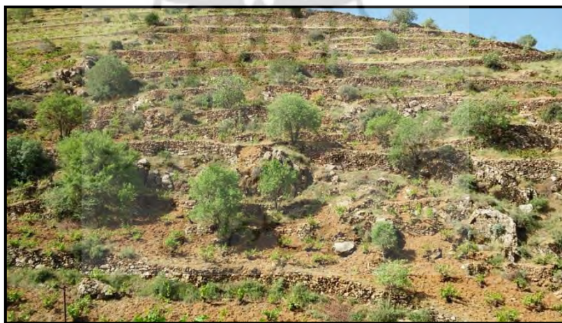
تصویر شماره ۳. درختان مناسب برای دیم؛ ون، گلابی کوهی و بلوط

در جاهایی از اورامان که آب وجود ندارد، تاکستان‌های دیم را به صورت گسترده کشت می‌کنند. بیشتر آنها نیز از انواع انگور سیاه هستند که بسیار مرغوب و در حد اعلاست. برای کاشتن مو و انگور دیم، ابتدا مکانی را در ناحیه معتدل و کوهستانی در نظر می‌گیرند و بعد از آن، شروع به دیوارچینی اطراف می‌کنند. روی دیوار هم از درختچه‌های خاردار پرچینی می‌سازند تا از رفت و آمد انسان‌ها و حیوانات جلوگیری شود، سپس زمین داخل آن را تا حد امکان از درختچه‌های زاید و سنگ‌های قابل حمل پاک می‌کنند و به طول ۲ متر در ۲ متر گودال‌هایی به عمق ۳۰ تا ۴۰ سانتیمتر حفر و آماده می‌کنند تا فصل کاشت فرا رسد. البته در حد امکان از درختان جنگلی هم نگهداری می‌کنند؛ بخصوص درختانی مانند ون، گلابی کوهی و بلوط.