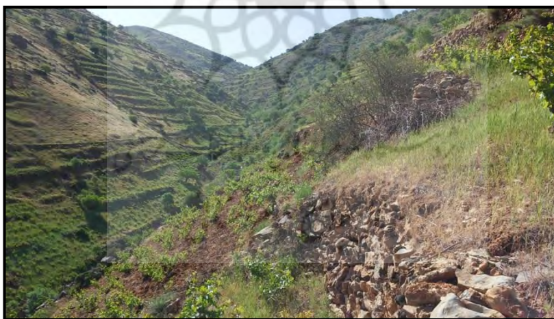
تصویر شماره ۸. هم‌زیستی درختان بادام و گلابی دیمی در کنار باغ‌های مو

بهترین زمان برای کاشت درخت مو ماه اسفند است. ابتدا باید قلمه‌هایی از درختچه مو تهیه کرد که عمر آنها از دو سال بیشتر باشد. قسمت دو ساله را کمی می‌تراشند و در چال‌ها قرار می‌دهند سپس اطراف آنها خاک نرم و بدون سنگریزه می‌ریزند و در سال اول و دوم، در صورت امکان دو تا سه بار به آنها آب می‌دهند. هر سال نیز اطراف آنها را با کلنگ زیر و رو می‌کنند تا زمین نرم و عاری از گیاهان مزاحم باشد. بعد از دو سال که ساقه‌ها بلند شد، باید قبل از فرا رسیدن بهار آنها را هرس کنند و ساقه‌های زاید را ببرند. در ماه دوم بهار هم باید جوانه‌های زاید را که در زیر و کنار درخت مو رشد می‌کنند، با دقت کامل بردارند، به این ترتیب، بعد از سال سوم و چهارم شاخه‌ها به بار خواهد نشست، البته در کنار این تاکستان‌ها جدا از درختان جنگلی، گاه درختان دیگری نیز همانند بادام و گلابی دیمی کشت می‌شوند که با توجه به طبیعت سازگار آنها، به موقع به بار می‌نشینند، تصاویر زیر نمونه‌هایی از رزهای دیم را در شهرستان پاوه نشان می‌دهد. اگر به خوبی دقت کنیم، درختان بسیاری را در کنار باغ‌های مو مشاهده می‌کنیم.