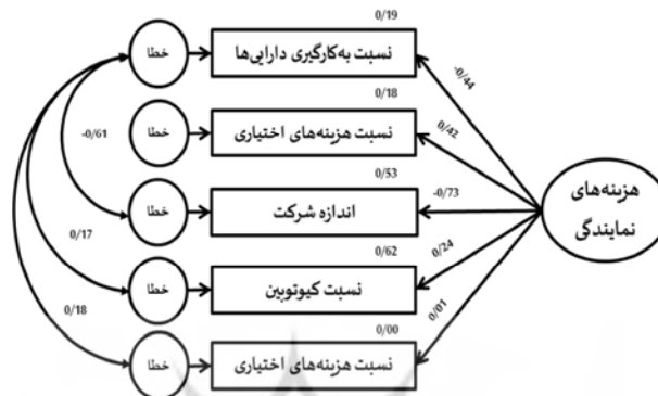
نمودار (۲). الگوی اندازه‌گیری اصلاح شده هزینه‌های نمایندگی به همراه بارکنش‌ها

جواب این پرسش است که آیا الگوی مفهومی، داده‌های پژوهش را نمایندگی می‌کند؟ اعتبار یک الگو با استفاده از معیارهای نیکویی برازش ۱۲ مورد بررسی قرار می‌گیرد. بنابراین، در این مرحله از تجزیه و تحلیل‌های آماری انتظار بر این است که برازش داده‌ها به الگوی مفهومی پژوهش بر اساس معیارهای علمی، قابل قبول باشد. نمودار (۲) الگوی اندازه‌گیری اصلاح شده هزینه‌های نمایندگی را به همراه بارکنش‌های مربوط به این الگو را ارائه می‌نماید: