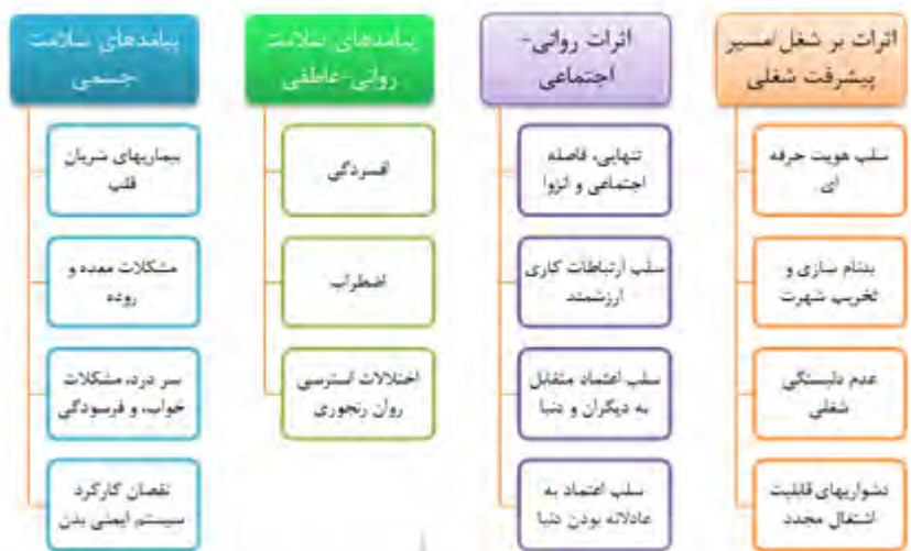
شکل ۵. آثار (نتایج) موبینگ بر سلامتی و بهزیستی جسمی و روحی در محیط‌های آموزشی (Duffy & Sperry, 2014, P. 76)

نتیجه مطالعه مرتبط دیگر نیز نشان می‌دهد با رواج انواع موبینگ (بالا به پایین، پایین به بالا و هم سطح)، تقابل‌های مخرب از طریق: افزایش نرخ ترک شغل و میزان غیبت، تضعیف روحیه و ایجاد برآشفستگی، خستگی مفرط، خدشه‌دار کردن تصویر سازمان و روابط کارکنان، اثرات منفی متقابل بر روی کارکنان، مدیران و سازمان خواهد داشت (Serkan & Hakan, 2016).