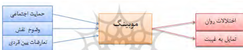
شکل ۲. عوامل روانی-اجتماعی موثر بر رفتارهای موبینگ سازمانی و پیامدهای آن (Hugo et al. 2012)

در یک مطالعه میدانی که بر روی ۴۲۲ نفر از کارکنان موسسات توانبخشی معلولان در اسپانیا انجام شد، پژوهشگران آن با در نظر گرفتن عوامل روانی-اجتماعی موثر بر رفتارهای موبینگ در محیط کاری که می‌تواند منجر به اختلالات روان تنی در بین کارکنان شود، این‌گونه نتیجه‌گیری کردند که رفتارهای موبینگ اثر قابل ملاحظه‌ای بر سلامت کارکنان دارد و می‌تواند باعث افزایش غیبت شغلی و سایر نتایجی شود که ناشی از اختلالات روان تنی در بین کارکنان است (Hugo et al. 2012). در الگوی آنان، عوامل روانی اجتماعی موثر بر موبینگ شامل: (عدم حمایت اجتماعی، عدم وضوح نقش و تعارضات بین فردی است که با ایجاد یا تشدید رفتارهای موبینگ (به عنوان عامل میانجی) در بین کارکنان، موجب اختلالات روان تنی و تمایل به غیبت شغلی در بین کارکنان می‌شوند. الگوی هوگو همکاران در شکل شماره ۲ ارایه شده است.