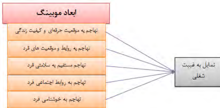
شکل ۱. اثر ابعاد موبینگ بر تمایل کارکنان به غیبت شغلی (Serkan & Hakan, 2016)

در مطالعه ای که بر روی معلمان و مدیران مدارس ترکیه انجام شد، موبینگ با این ۱۹ سنجه مورد آزمون قرار گرفت (Ertürk & Cemaloğlu, 2014): (۱) افزایش سخن چینی و شایعات درباره فرد؛ (۲) نادیده گرفتن (به حساب نیاوردن) فرد؛ (۳) نظرات توهین یا تحقیر آمیز درباره عادات، گذشته، نگرش‌ها یا زندگی خصوصی فرد؛ (۴) تمسخر و تحقیر فرد درباره کار وی؛ (۵) داد و فریاد زدن یا فرد را مخاطب خشم خود قرار دادن؛ (۶) محول کردن وظایفی به فرد تا سر حد توانمندی‌های وی؛ (۷) به طور ضمنی فهماندن یا گفتن این که فرد باید شغلش را ترک کند؛ (۸) کنترل صحت انجام کار فرد، فراتر از حد متعارف و به روشی اغراق آمیز (موازی ماست کشیدن)؛ (۹) زیر سؤال بردن و نکوهش مستمر کار و تلاش فرد؛ (۱۰) گرفتن مسوولیت‌های شغلی یک فرد و دادن تکالیفی ناخوشایند به وی؛ (۱۱) یادآوری مستمر خطاها و اشتباهات فرد؛ (۱۲) فرد را در معرض اقداماتی همانند: با انگشت نشان دادن، مداخله در امور شخصی، و در کمین و مورد خف قرار دادن؛ (۱۳) نسبت دادن جوک‌ها و تمسخرهای دور از شأن به فرد؛ (۱۴) نادیده گرفتن و بی توجهی به فرد، هنگام ملاقات با دیگران؛ (۱۵) به ستوه آوردن و تحقیر مستمر فرد؛ (۱۶) درخواست وظایف غیرمنطقی یا ناممکن از فرد؛ (۱۷) مواجه کردن فرد با حجم و فشار زیادی از کار؛ (۱۸) نادیده گرفتن دیدگاه‌ها، ایده‌ها و پیشنهادهای فرد؛ (۱۹) پنهان کردن اطلاعاتی که بر دستاوردها و یا عملکرد فرد اثرگذار است.