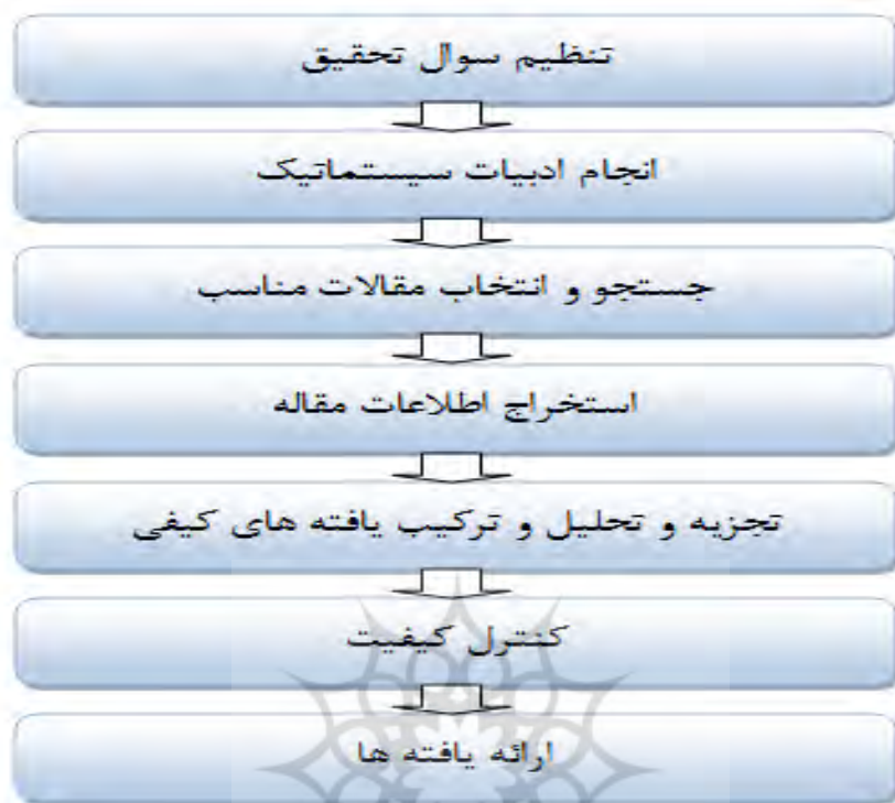
شکل ۲: گام‌های فراترکیب

در این تحقیق از روش «فرا ترکیب» برای ارائه الگوی مطلوب فرماندهی از منظر اسلام و بیانات رهبری (مدظله‌العالی) استفاده شده است. برای گردآوری داده‌های تحقیق، از داده‌های ثانویه به نام اسناد و مدارک گذشته استفاده شده است. این اسناد و مدارک شامل تمامی پژوهش‌های صورت گرفته (اعم از پژوهشی و مروری) در زمینه تحقیقات ارائه الگوی فرماندهی از منظر اسلام و بیانات رهبری (مدظله‌العالی) بوده است. این نحوه گردآوری داده‌ها به تحلیل اسنادی نیز معروف است. در فرا ترکیب متن پژوهش‌های گذشته (اعم از مروری و پژوهشی) به‌عنوان داده‌ها محسوب می‌شود که دقیقاً همانند متن مصاحبه مستند شده است.