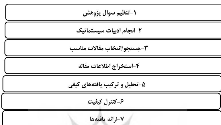
شکل ۲. گام‌های فرا ترکیب (ساندوسکی و باروس، ۲۰۰۷)

ترکیب، مرور یکپارچه ادبیات کیفی موضوع مورد نظر نیست، بلکه تجزیه و تحلیل یافته‌های این مطالعه‌ها است. به عبارتی‌دیگر، فراترکیب، ترکیب و تفسیری از تفسیرهای داده‌های اصلی مطالعه‌های منتخب است. به منظور تحقق هدف پژوهش که همان آسیب‌شناسی پژوهش‌های گذشته در حوزه