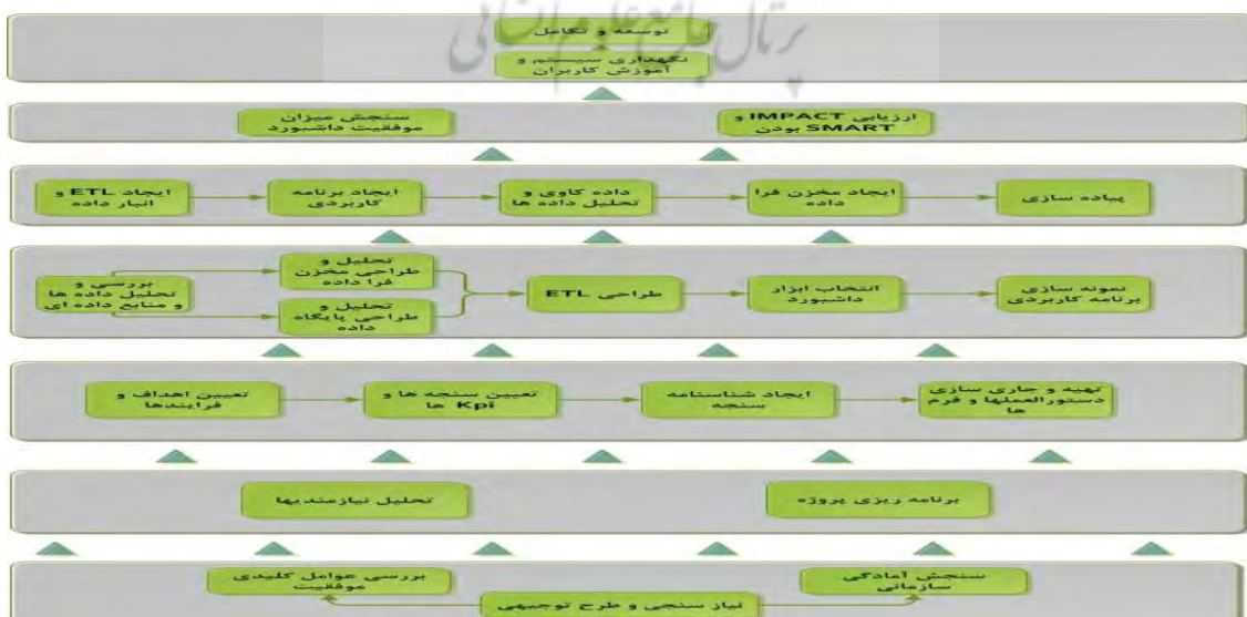
شکل ۲. مدل مضامین پایه توسعه داشبورد سازمانی با منطق هوش تجاری

در مرحله دوم مدل‌سازی مضامین پایه انجام شد که با توجه به مقایسه زوجی ۲۴ مضمون دارای پیچیدگی‌های خاص خود بود. خروجی مدل در شکل ۲ نمایش داده شده است.