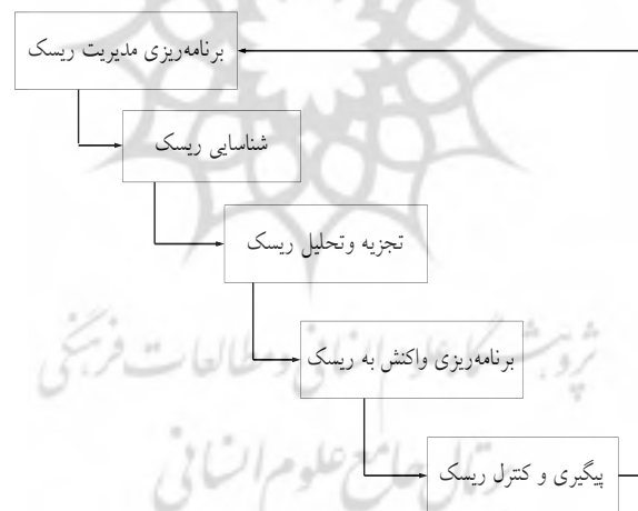
شکل ۱- فرایند ارزیابی و اولویت‌بندی ریسک واردات کالا مبتنی بر روش PMBOK

برای انجام مدیریت ریسک پروژه، مدل‌های مختلفی مطرح شده است؛ ولی تاکنون برای مواجهه با ریسک‌های مرتبط با تحریم در تجارت خارجی و از جمله واردات کالا مدلی ارائه نشده است؛ از این‌رو در این پژوهش با الهام از مدل PMBOK ۳۵ (که یکی از جامع‌ترین مدل‌ها برای مدیریت ریسک است) مدل جدیدی برای ارزیابی و اولویت‌بندی ریسک‌های واردات کالا در شرایط تحریم ارائه می‌شود. این مدل شامل پنج مرحله برنامه‌ریزی، شناسایی، تجزیه و تحلیل، برنامه‌ریزی واکنش به ریسک و کنترل و پیگیری ریسک است. این فرایند در شکل (۱) ارائه شده است.