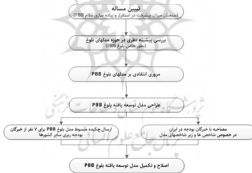
شکل ۱ مراحل توسعه مدل بلوغ بودجه‌ریزی بر مبنای عملکرد

روش انجام از نوع توصیفی است. پدیده مورد توصیف در این تحقیق بلوغ بودجه‌ریزی بر مبنای عملکرد است. روش‌های مهم گردآوری اطلاعات در این مطالعه عبارت از مطالعات کتابخانه‌ای (برای فهم و شناخت موضوع)، نظرسنجی از خبرگان (برای بررسی اعتبار و صحه گذاری بر ابعاد و معیارهای بلوغ بودجه‌ریزی بر مبنای عملکرد) است. با توجه به این‌که در این تحقیق به مدل‌سازی مفهومی بلوغ بودجه پرداخته شده است، مدل تحقیق برای تمامی دستگاه‌هایی که از بودجه عمومی کشور استفاده می‌کنند قابلیت کاربرد دارد. جامعه‌ای که برای احصا شاخص‌ها در این تحقیق مورد استفاده قرار گرفته عبارت از جامعه خبرگان بودجه‌ریزی در سازمان مدیریت و برنامه‌ریزی کشور، استادان دانشگاهی ایرانی و برخی از متخصصان بودجه‌ریزی در سایر کشورها که دانش و آگاهی مناسبی نسبت به مدل‌های بلوغ بودجه‌ریزی دارند، است. ابزار گردآوری اطلاعات در این تحقیق مصاحبه‌های نیمه ساخت‌یافته، پرسش‌نامه و گزارش‌های عملکردی است. مراحل انجام این تحقیق خلاصه در فلوچارت شکل ۱ ارائه شده است.