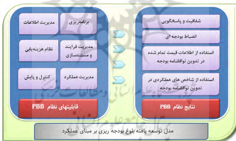
شکل ۲ مدل توسعه یافته بلوغ بودجه‌ریزی بر مبنای عملکرد

میزان استفاده از اطلاعات عملکردی دستگاه در تدوین بودجه نیز مانند سومین شاخص نتایج حایز اهمیت است. زیرسیستم مدیریت عملکرد در بخش قابلیت‌های مدل بلوغ تعریف شده است. با این حال صرف وجود یک زیرسیستم مدیریت عملکرد و عدم توجه در به کارگیری اطلاعات این زیرسیستم در تصمیم‌گیری و تدوین بودجه نمی‌تواند تصویر دقیقی از سطح بلوغ بودجه یک دستگاه در بحث مدیریت عملکرد ارائه نماید. بهره‌گیری از اطلاعات عملکردی در تدوین بودجه چهارمین شاخص نتایج در مدل بلوغ بودجه‌ریزی بر مبنای عملکرد است. به این ترتیب مدل توسعه یافته بلوغ بودجه‌ریزی بر مبنای عملکرد با در نظر گرفتن هر دو لایه از مدل بلوغ یعنی قابلیت‌ها و نتایج به شرح شکل ۲ است.