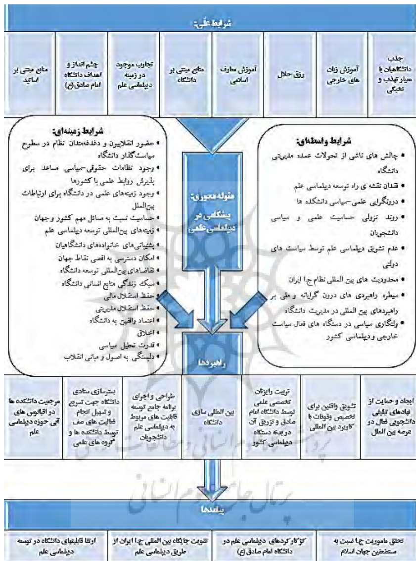
شکل ۱ مدل نظام‌مند و پارادایمی توسعه دیپلماسی علمی در دانشگاه امام صادق (ع)