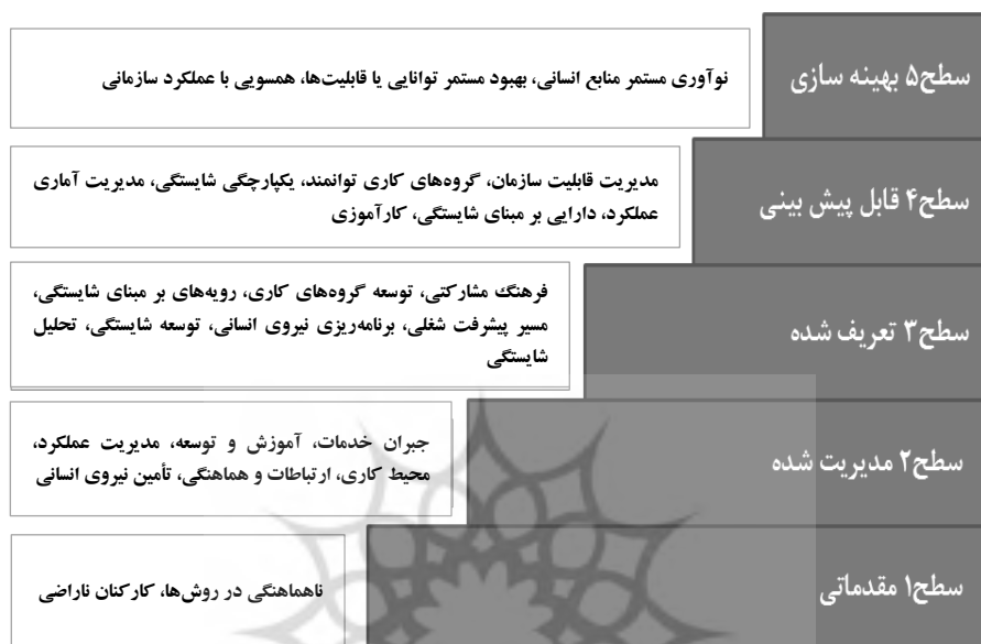
شکل ۱. مدل بلوغ قابلیت نیروی انسانی

سازمان را که در آن نیروی کار رشد می‌کند، بالاتر می‌برد. در چنین محیطی، افراد شانس بیشتری برای رشد توانایی حرفه‌ای پیدا می‌کنند و برای همسو کردن عملکرد خود با مقاصد سازمان، انگیزه بیشتری می‌یابند (کرتیس و همکاران، ۲۰۰۲: ۱۵).