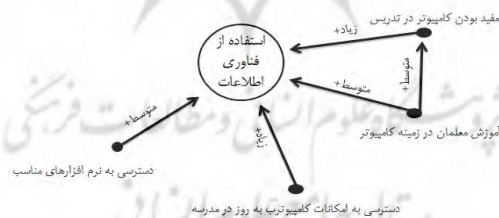
شکل ۱. نمونه‌ای از نقشه‌های شناختی فازی طراحی شده توسط یکی از معلمان

در پژوهش حاضر از روش مصاحبه برای گردآوری داده‌ها استفاده شد. بدین‌صورت که ابتدا توضیحاتی در مورد تحقیق حاضر به آنان ارائه گردید. سپس از آنان خواسته شد که روی یک کاغذ پدیده اصلی یعنی استفاده از فن‌آوری رایانه در کلاس درس را در مرکز صفحه با شکل دایره رسم کنند. سپس در اطراف آن عوامل مؤثر را ترسیم کنند. در ادامه از آنان خواسته شد فلش‌هایی را از آن عوامل به سمت استفاده از فن‌آوری اطلاعات ترسیم کنند و روی فلش‌ها مثبت یا منفی بودن و همچنین میزان تأثیر (کم، متوسط، زیاد و خیلی زیاد) را مشخص کنند. در نهایت از آنان خواسته شد در صورتی که این عوامل بر یکدیگر نیز تأثیر می‌گذارند، آن‌ها را با فلش به هم وصل کرده و میزان تأثیر را نیز مشخص کنند. استفاده از این رویکرد زمانی که پاسخگویان اطلاعات غنی در مورد پدیده مورد بررسی دارند توصیه شده است (اوزسمی و اوزسمی، ۲۰۰۴). در شکل ۱، یک نمونه از نقشه‌های شناختی فازی طراحی شده توسط یکی از معلمان نشان داده شده است.