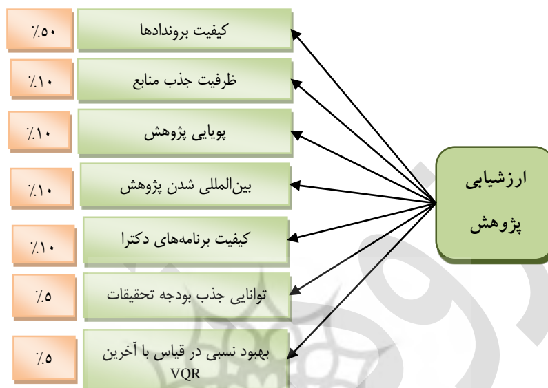
شکل ۲. چارچوب سنجش کیفیت پژوهش در سیستم VQR ایتالیا

بزهوش هیئت‌علمی (۱۰٪)، بین‌المللی شدن (۱۰٪)، کیفیت برنامه‌های دکترا (۱۰٪)، توانایی جذب بودجه تحقیقاتی (۵٪) و بهبود نسبی در قیاس با آخرین VQR (۵٪).