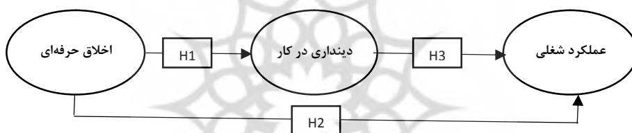
شکل ۱. مدل مفهومی پژوهش (محقق ساخته)