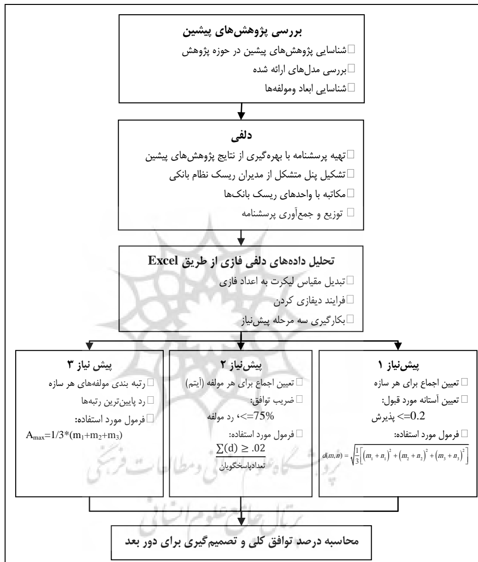
شکل ۱: فرایند پژوهش